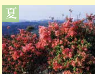
夏 ツツジ/青山高原