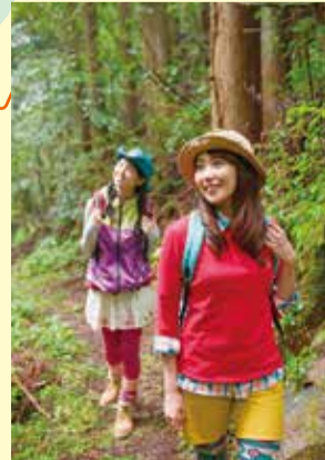
美杉森林セラピー