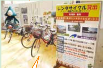
道の駅美杉、コルチカムの里(伊勢奥津駅前)、美杉総合支所でレンタサイクル可能