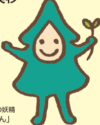
美杉の森の妖精「みずぎん」