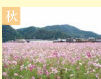
秋 コスモス/とことめの里一志